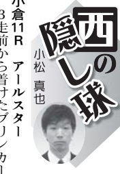
小倉11R アールスター